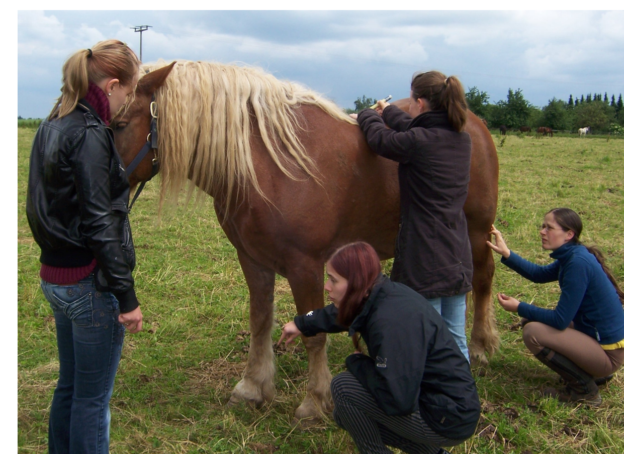
Abb. 4: Interdisziplinäre TCM: AK-Mitglieder beim Akupunktieren eines Pferdes, Juni 2010