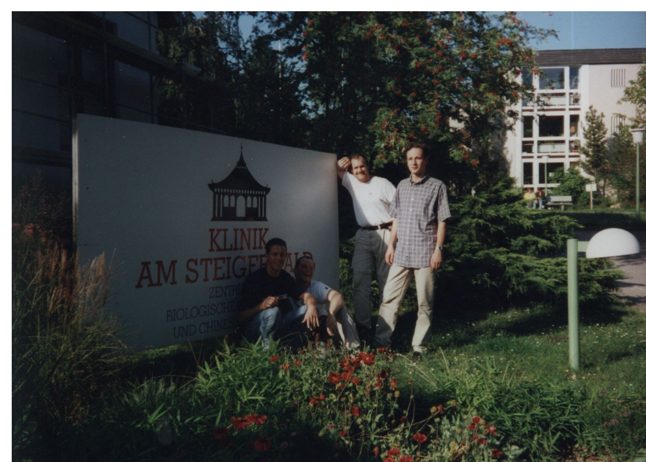
Abb. 1: Hospitation in der Klinik am Steigerwald, Ende der 90er

Durch die umfassende und hochwertige Studentenausbildung konnte erreicht werden, dass Kursabsolventen Vergünstigungen an den führenden Ausbildungsschulen für TCM erhalten. Für einen Einstieg ins Chinesische sorgte 1997 ein Sprachkurs bei Prof. Unschuld. Zudem wurde 2000 ein wöchentlicher Qi Gong-Kurs durch Arif Siddiqui und Eckart Metje ins Leben gerufen und es fanden regelmäßig Wochenendseminare zu Themen wie Tuina, Shiatsu, Psychotonik und Fußreflexzonenmassage statt; beides wird bis zum heutigen Tag weitergeführt. Eine Einweisung in asiatischer Kampfkunst begann Mitte der 90er mit einem Kung Fu Kurs bei Tim Bongartz und später bei Marco Schmitz, Rüdiger Heidenblut, Stephan Lemm und Elias Scaparra, sowie ab 2011 ein Aikido-Kurs bei Christoph Colling.