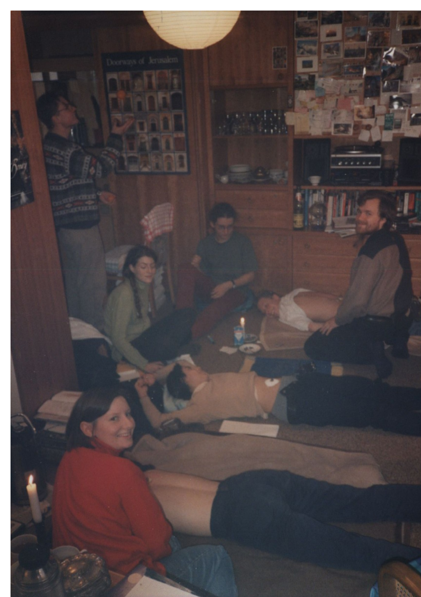
Abb. 3: Gegenseitiges Moxen, Ende der 90er

Im Zuge der evidence-based medicine führte der AK in Zusammenarbeit mit Dr. Hummelsberger eine Studie zur Untersuchung diätetischer Einflüsse auf den chinesischen Zungenbefund durch, die dann 2011 auf dem SMS-Kongress vorgestellt wurde.